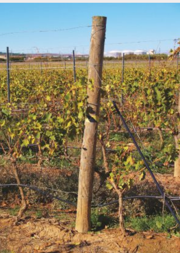
Ramadas de vinhedos