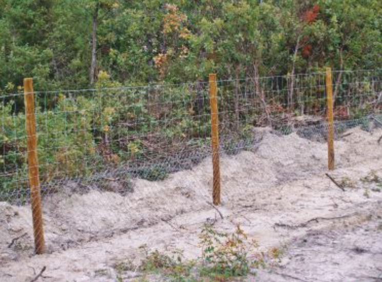
Construção de cercados