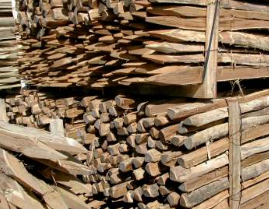
Abiertos "al hilo".