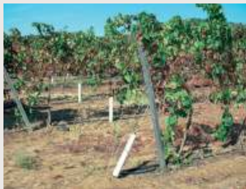
Piquetes de acacia