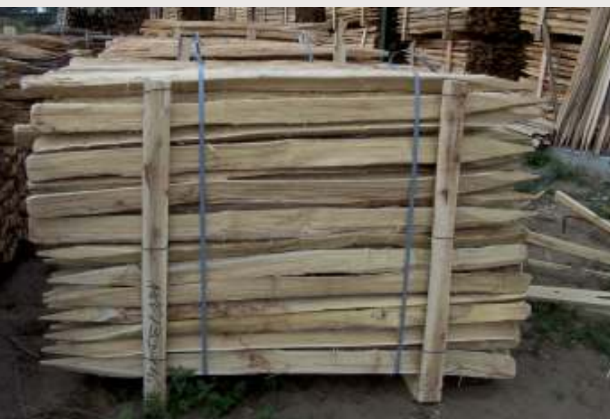
Abiertos "al hilo".