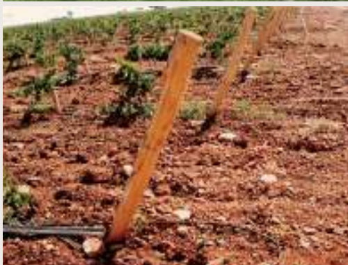
Columnas de acacia