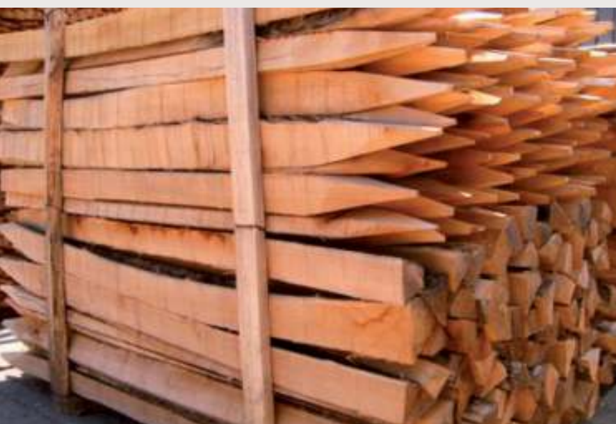
Serrados a dos caras.