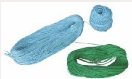
Meadas e novelos